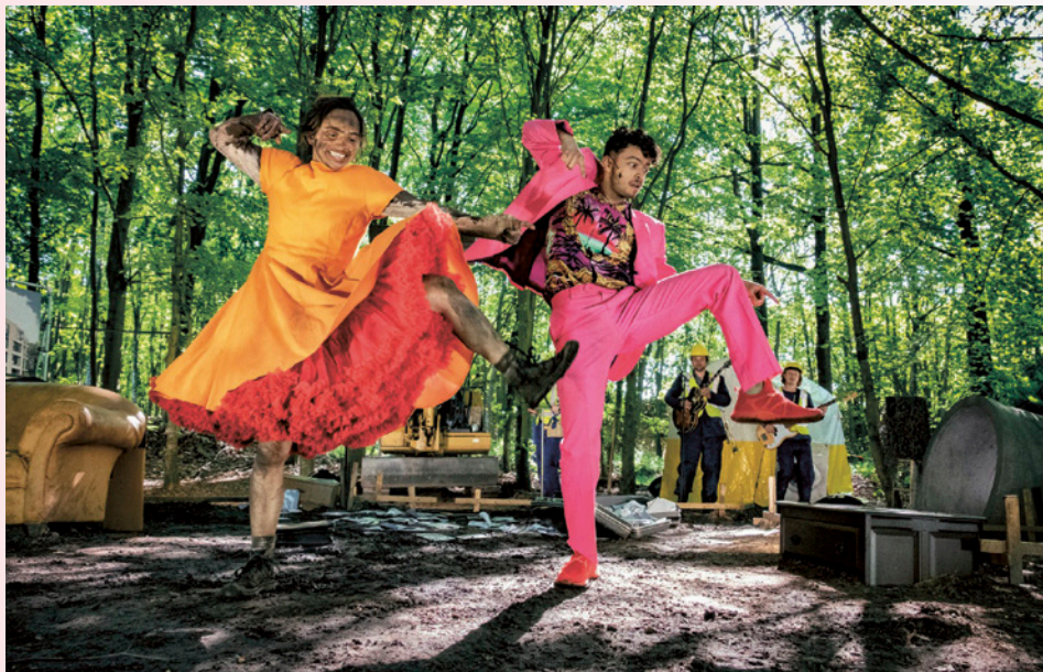
Hier valt niets te halen, regie: Maarten Smit, Wabi Sabi Theater in coproductie met Het Houten Huis & Peergroup; locaties Groningen, Terschelling, Veenhuizen 2023; netwerk Station Noord