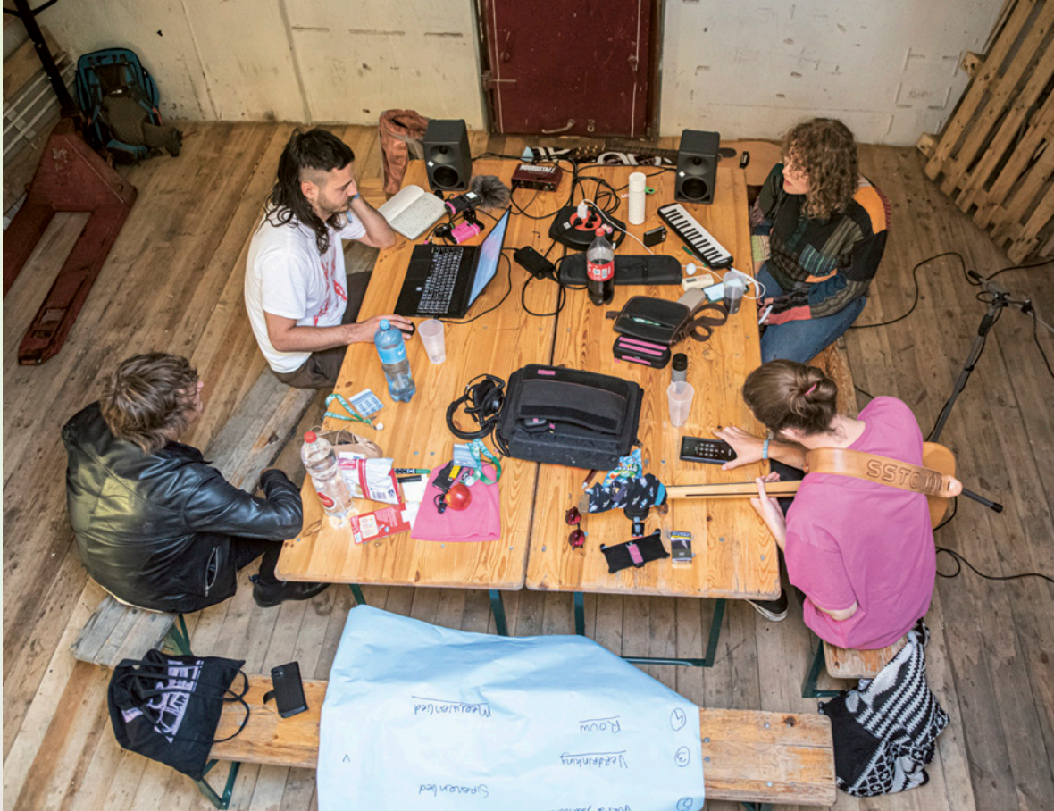
Hit the North Bootcamp 2023

"Tijdens het afgelopen half jaar Hit the North hebben we geleerd hoe we als band moeten professionaliseren en wat daar voor nodig is, en hebben we onze eigen weg kunnen vinden wat betreft branding en identity".