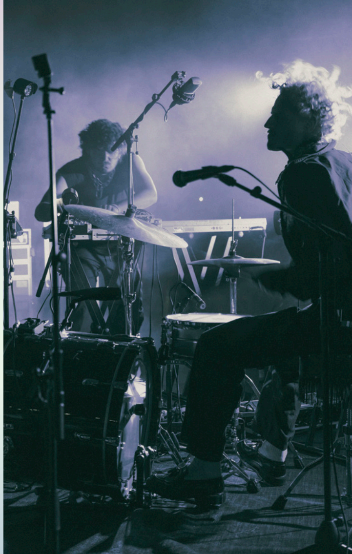
NOORD deelnemende act Velocity Made God, showcase op ITGW0

"Hit the North is een traject wat iedere act, waar je ook staat in je ontwikkeling, naar een volgende stap helpt. Super interessante coaches, een hele leuke groep, en een budget wat je zelf in mag zetten, aan dat waar jij daadwerkelijk iets aan hebt."